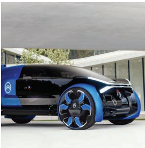
» Pnevmatika Goodyear C100 je bila izdelana posebej za avtonomno konceptno vozilo Citroën 19_19

Premer pnevmatike C100 meri skoraj en meter, kar je za okoli 40 centimetrov več od povprečja pnevmatik, zato bi s svojo visoko in ozko zasnovo voznikom zagotavljala zmogljivost, udobje in boljše vozne lastnosti na mokri podlagi, njen manjši kotalni upor pa bi povečal tudi energetske učinkovitost vozila. Po meri je oblikovan tudi vzorec tekalne plasti, ki bi s skoraj sto bloki več, kot jih ima v tekalni plasti običajna pnevmatika, doprinesel k občutno tišji vožnji. Pri oblikovanju vzorca so pri Goodyearu navdih črpali iz narave, saj zmes kanalov tekalne plasti posnema lastnosti naravne gobe. Zaradi tega bi tekalna plast v suhih razmerah postala bolj toga, v mokrem pa bi se zmehčala, posledično pa bi pnevmatika pridobila boljše lastnosti pri zaviranju v vseh razmerah, hkrati pa tudi boljši oprijem in vodljivost.