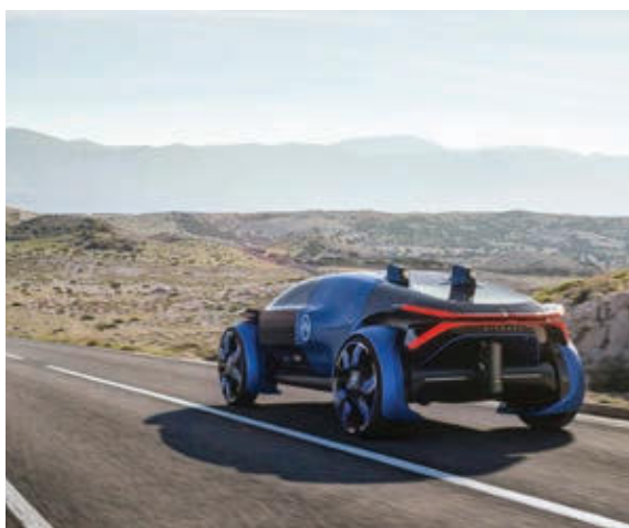
» Vzorec s skoraj sto bloki več, kot jih ima navadna pnevmatika, doprinese k tišji vožnji

Premer pnevmatike C100 meri skoraj en meter, kar je za okoli 40 centimetrov več od povprečja pnevmatik, zato bi s svojo visoko in ozko zasnovo voznikom zagotavljala zmogljivost, udobje in boljše vozne lastnosti na mokri podlagi, njen manjši kotalni upor pa bi povečal tudi energetske učinkovitost vozila. Po meri je oblikovan tudi vzorec tekalne plasti, ki bi s skoraj sto bloki več, kot jih ima v tekalni plasti običajna pnevmatika, doprinesel k občutno tišji vožnji. Pri oblikovanju vzorca so pri Goodyearu navdih črpali iz narave, saj zmes kanalov tekalne plasti posnema lastnosti naravne gobe. Zaradi tega bi tekalna plast v suhih razmerah postala bolj toga, v mokrem pa bi se zmehčala, posledično pa bi pnevmatika pridobila boljše lastnosti pri zaviranju v vseh razmerah, hkrati pa tudi boljši oprijem in vodljivost.