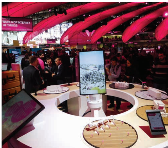
» Internet stvari će se doticati svega oko i na, te čak u nas.

O tome, kako tehnologija može promijeniti poslovanje, znamo mnogo. Mreže, Internet, senzori, komunikacija među strojevima i uređajima ... Sve je povezano i komunicira u stvarnom vremenu i po mogućnosti bez grešaka. Danas je u svijetu 7 milijardi ljudi, a približno toliko je i mobilnih telefona. Ukoliko u jednadžbu dodamo i sve senzore i druge pametne uređaje, pripremljene za automatiziranu komunikaciju, brojke ludo rastu. Cisco ocjenjuje da će 2020. godine na svijetu međusobno komunicirati već oko 50 milijardi uređaja (i ljudi, naravno).