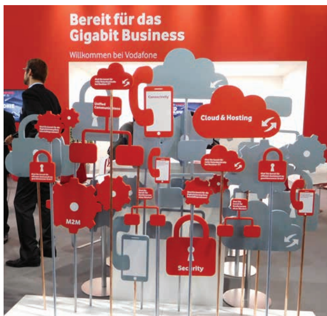
» Tako izgleda zemljovid mobilno-digitalnog svijeta.

Lijep primjer, kako prije svega telekomunikacijske tehnologije omogućuju nova poslovna rješenja u industriji, je vlak najvećeg ponuditelja ugljena. On iz jednog od svojih rudnika »crno zlato« vozi s sa specijalnom kompozicijom vlaka, dugom 2,5 kilometara. Za pokretanje više tisuća tona teške kompozicije, potrebne su tri super snažne lokomotive – jedna se nalazi u sredini kompozicije, a po jedna na početku i kraju kompozicije vlaka. Inženjeri su imali mnogo izazova kako bi krajnje točno sinkronizirali djelovanje svih lokomotiva u svim radnim uvjetima. Pogoni lokomotiva međusobno komuniciraju u stvarnom vremenu, a kako bi zajedno na čitavoj trasi djelovali besprijekorno brine najnovija eLTE tehnologija, koja se pokazala kao jedina primjerena, jer klasične WiFi te GSM-R tehnologije nisu mogle udovoljiti takvom izazovu.