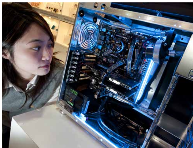
» Voda u računalu: tvrtka EnzoTech iz China u Kaliforniji razvila je više učinkovitih rješenja za vodeno hlađenje poslužitelja

na centralnom poslužitelju, a drugdje se po potrebi zapisuju samo „reference“ koje na njih ukazuju. Blokovi podataka se također bilježe samo na jednom centralnom mjestu, a drugdje, gdje bi se morali pojaviti, zapisuju se samo veze do njih. Kod upotrebe se reference, odnosno veze trenutno zamjenjuju, pa korisnik vidi i upotrebljava prave datoteke odnosno podatke. Prostor za rezervne kopije se na taj način može smanjiti čak na