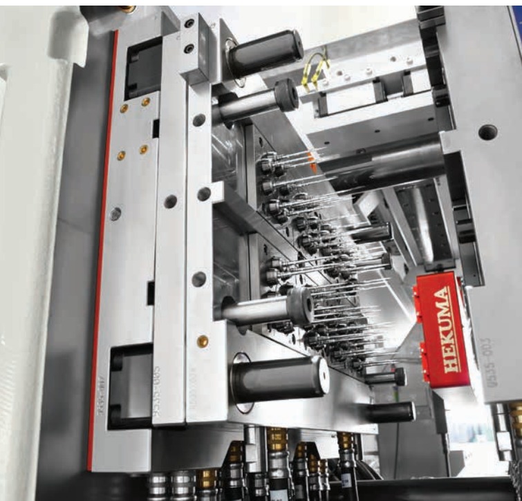
» Brojne aplikacije su prikazivale i kompleksne kalupe za injekcijsko prešanje s više kalupnih šupljina.