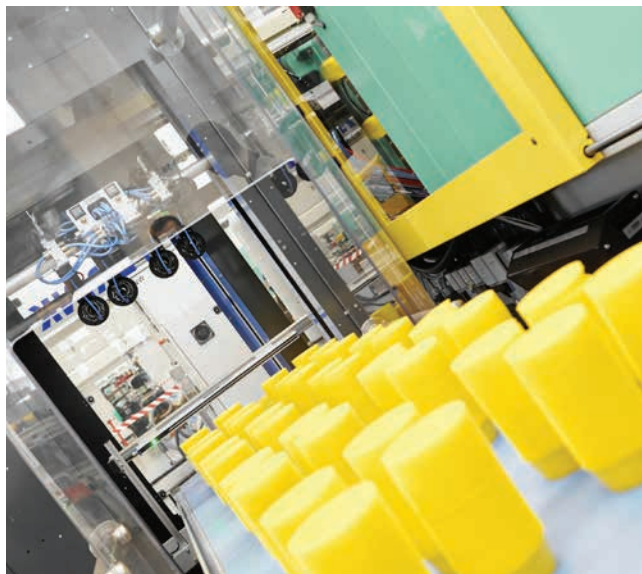
» Pored samih ubrizgavalica bilo je moguće vidjeti mnoštvo periferne opreme kao što su roboti, hvatači, trakovi, ...

Naravno da je bilo moguće vidjeti i velik broj novih i inovativnih načina primjere. Kao primjer učinkovite lake konstrukcije, Arburg je predstavio fizikalnu tehniku pjenjenja Profoam na primjeru poklopca pretinca za rukavice od PC/ABS za unutrašnjost vozila. S promjenjivim temoeriranjem kalupa moguće je, unatoč tehnici pjenjenja, postići površinu s visokom sjajem. Element koji je u cijelosti načinjen tako, da je primjeren za pjenjenje, ima svega 200 grama i tako je za oko 30 posto lakši od usporedivog kompaktnog dijela.