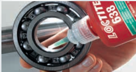
Lijepljenje cilindričnih dijelova