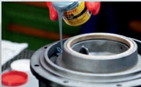
Popravak metalnih dijelova