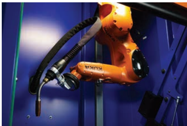
» Pri Brüninghaus & Drissner, WTG 1200 pouzdano radi u trosmjenskom režimu rada.

Već gotovo 60 godina Paul von der Bank GmbH je pouzdan partner, koji osigurava tehnologiju zavarivanja za isporučitelje u automobilskoj industriji, tvrtkama koje rade na području razvoja kontejnera i tehnologije grijanja ili za proizvođače gospodarskih vozila i tračničkih vozila. Tijekom godina, obiteljska tvrtka je izgradila svoje ime na nacionalnoj razini u području automatizacije tehnologija spajanja i rezanja. Njihovi kupci imaju prednosti u njihovom dugogodišnjem iskustvu u sektoru tehnologije zavarivanja. To također vrijedi i za posljednju inovaciju iz Paul von der Bank: WTG 1200 sustav zavarivanja, kojeg koriste primjerice u Brüninghaus & Drissner. »Kompaktni dizajn s integriranim PLC i potpuno programiranim priključcima za izvore napajanja, sekvencama stezanja i sigurnosnom opremom čine našu mini robotsku ćeliju fleksibilnom, snažnom i dostupnom,« pojašnjava Cornelia Hornemann, odgovorna za uvođenje proizvoda, procesne projekte i planiranje proizvodnje pri Paul von der Bank. S istim dimenzijama kakve ima Euro paleta – 1200 x 800 mm – to je