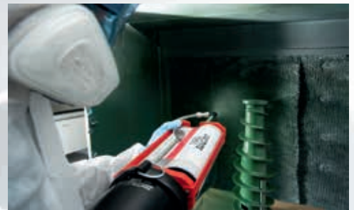
Premazi za površine

Industrijska ljepila, brtvila i rješenja za obradu površina