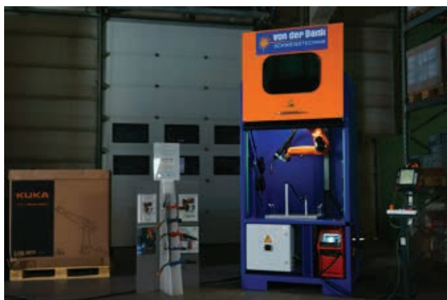
» U skućenom prostoru ova »Welding To Go« (WTG) 1200 ćelija i KUKA KR 10 R1100 sixx robot iz AGILUS serije pouzdano obavljaju zadatke zavarivanja.

Kako su tvrtke KUKA i Paul von der Bank sistemski partneri već 20 godina, u razmatranje je ušlo samo rješenje iz KUKA. »Otvoren operativni sustav, fleksibilno proširivo okruženje za programiranje i široki raspon nosivosti, sve su to argumenti za KUKA rješenja,« ističe Hornemann. Uz to, roboti serije KR AGILUS su sustavno konstruirani za prilično velike brzine rada. KR 10 R1100 sixx integriran na mini robotsku ćeliju u Brüninghaus & Drissner, pri-